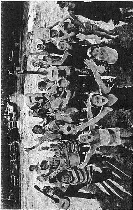
Una scena del film "Alalà" che sarà presentato al Festival

Oggi l'inaugurazione con un film omaggio a Paolo Villaggio, domenica i premi